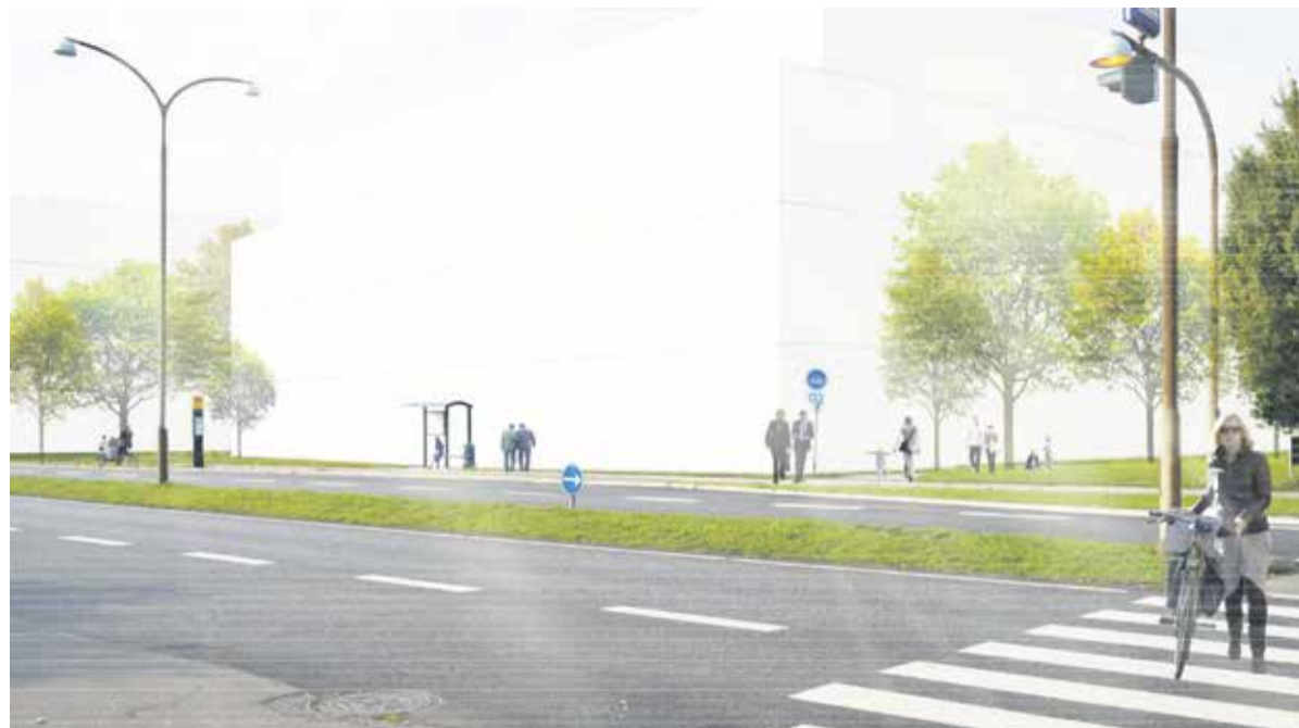
Illustration i høringmaterialet af byggeri lige op til Hvidegårdsparken og Trongårdsparken.

Hverken ved vedtagelsen af forslaget af kommuneplantillægget i december eller ved vedtagelsen af det endelige kommuneplantillæg i marts foregik der nogen drøftelse i kommunalbestyrelsen af dets konsekvenser for borgerne, selv om de vil blive meget store, og selv om der var mange uafklarede spørgsmål bl.a. trafikafviklingen. Det er endnu et eksempel på, at politikerne siger et og gør noget helt andet.