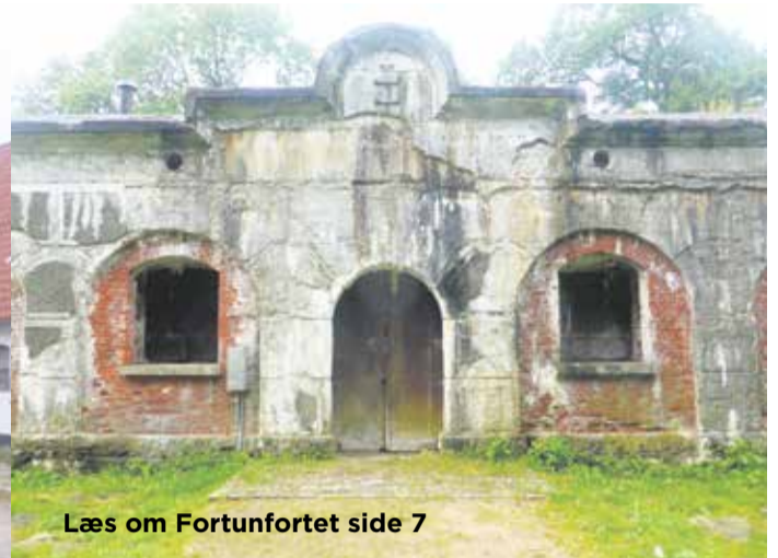
Læs om Fortunfortet side 7