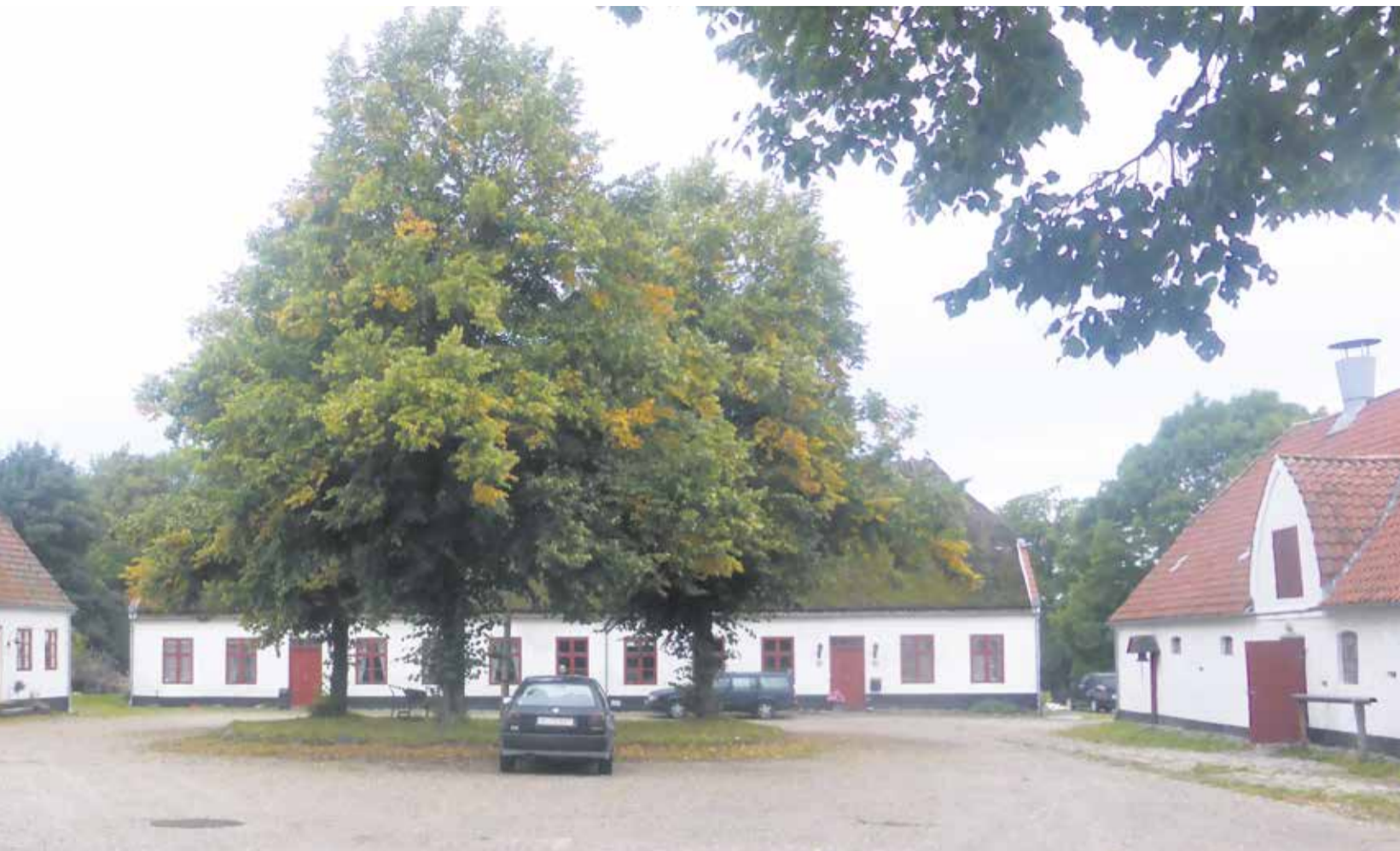
Dyrehavegård ejes af kommunen, men det er en forpagter, der står for driften af landbruget og hestepensionen, der har plads til 72 heste.

nen, men hævdede selv uberettiget EU-støtten, som i 2013 var på 230.000 kr.