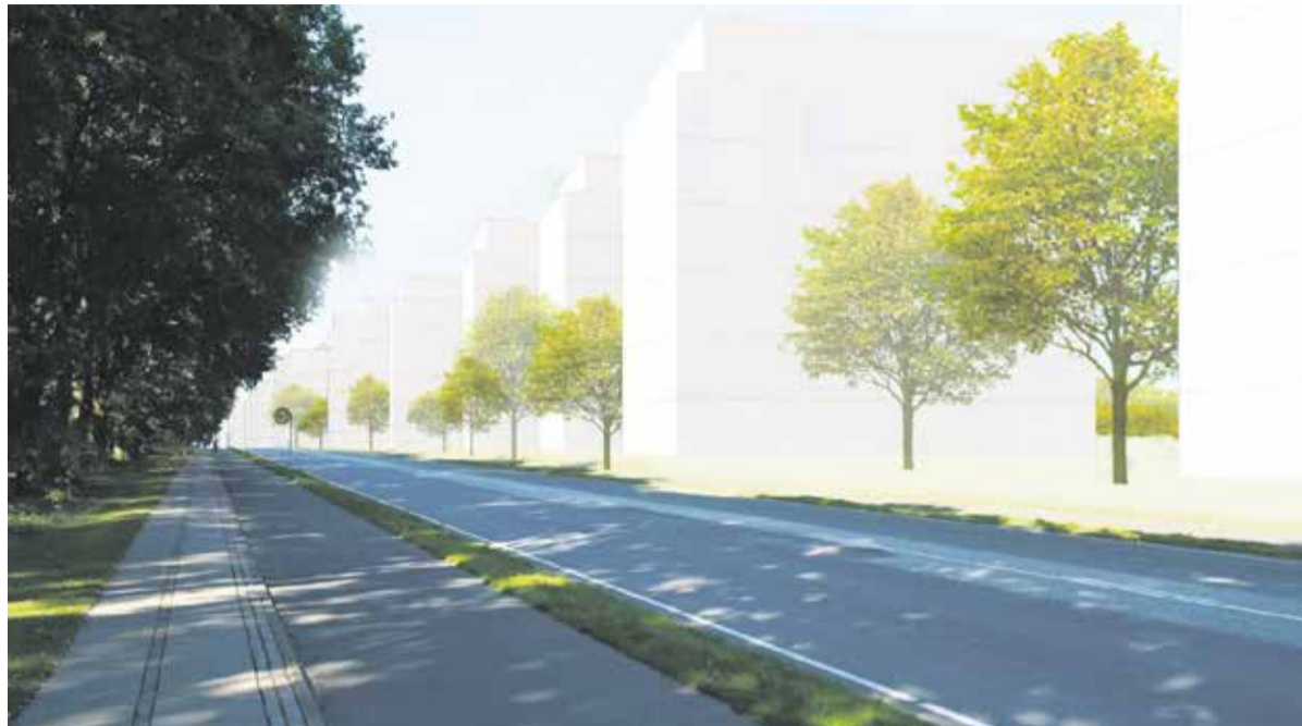
Skitse af byggeri i traceet i høringsmaterialet set fra Lundtoftegårdsvej

Kommunalbestyrelsen vil tillade et meget voldsomt nybyggeri på i alt 578.000 m 2 i op til 28 meters højde i området (traceet) mellem Helsingørmotorvejen og Lundtoftegårdsvej, på Dyrehavegårds jorde og på DTU. Dette byggeri vil forøge trafikken til og fra området med 19.220 bilture/dag og forringe oplevelsen af landskabet.