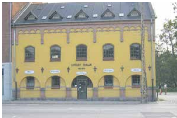
Lyngby Søndre Mølle.