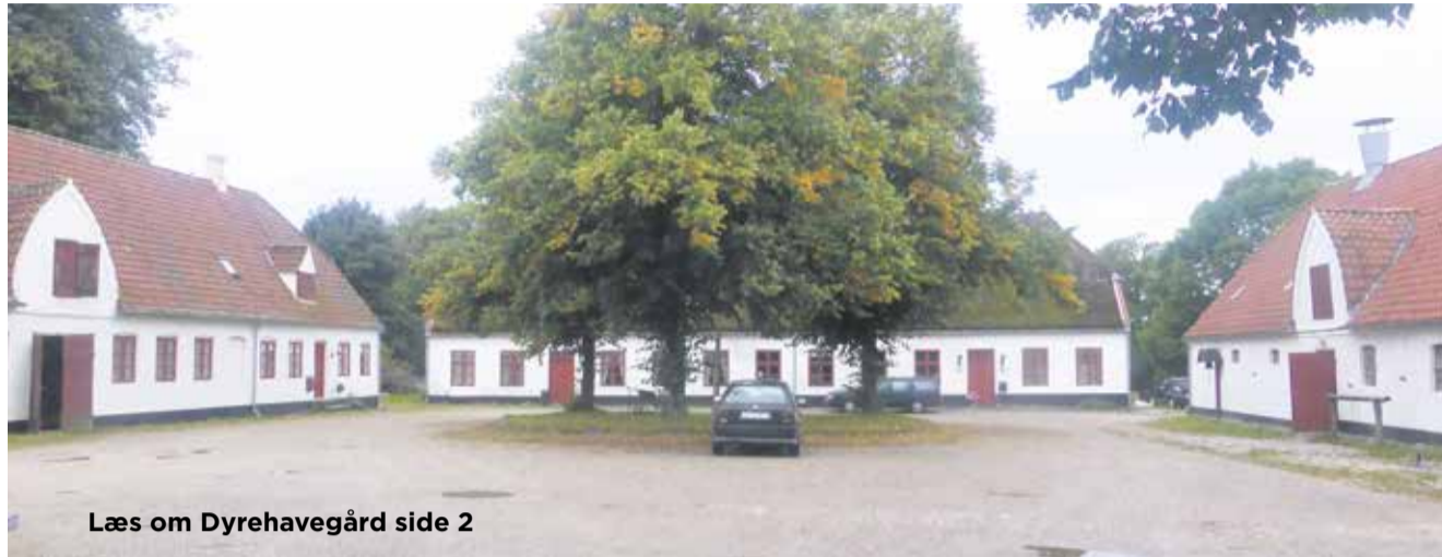
Læs om Dyrehavegård side 2